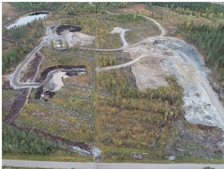
Fäbodtjärn industriområde -september 2023

Botnia Exploration har under detta, i omvärlden så oroliga år, närmat sig en produktionsstart med stora steg. Det faktum att omvärlden är orolig bidrar till att de ekonomiska förutsättningarna i form av guldpriset uttryckt i USD, fortsatt är gynnsamma för guldgruvor. Inte heller har den svenska kronan stärkts nämnvärt mot USD vilket alltså gör att guldpriset uttryckt i svenska kronor är historiskt sett på en hög, eller t.o.m. mycket hög nivå.