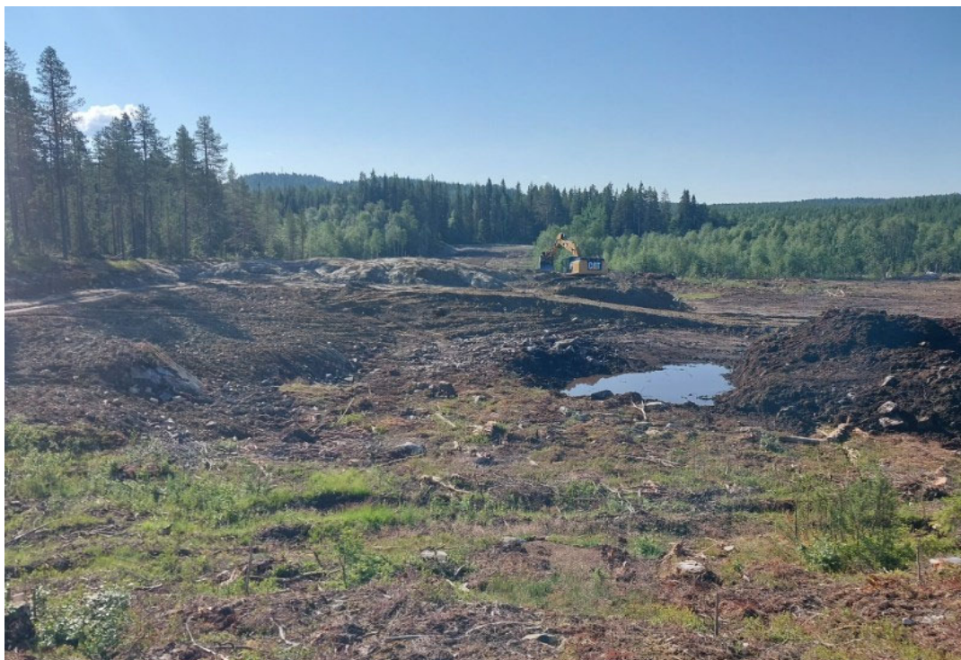
Bilden visar pågående markarbeten i Fäbodtjärn